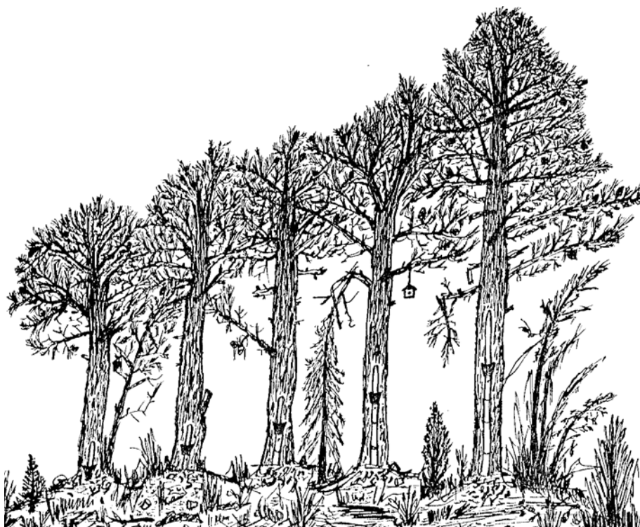
Cinco pinos rodenos resineros, con demostración de las distintas fases de resinación, del primero al quinto año. Dibujo a plumilla de J. Sánchez.