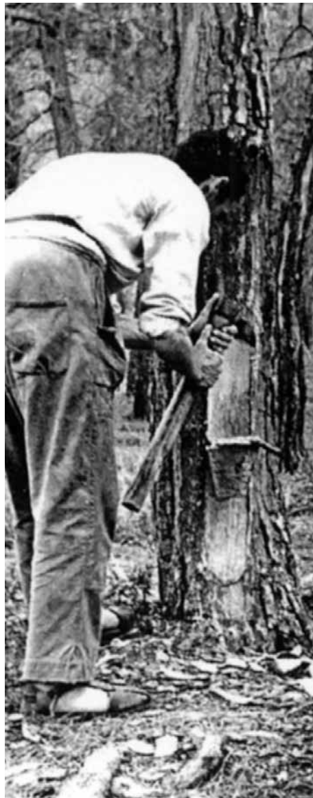
Explotación Resinera de Bezas. Picando pinos, 2º y 4º año del quinquenio. 1967-1969