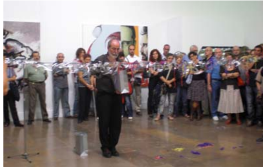
Algunas de las obras que se pueden visitar hasta el día 22 de Octubre de 2010