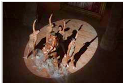
Un espectáculo de danza amenizó la inauguración de la exposición de Miguel Hernández.