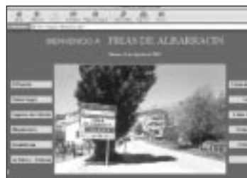
Frías de Albarracín