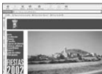
Castel de Cabra