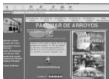
Palomar de Arroyos