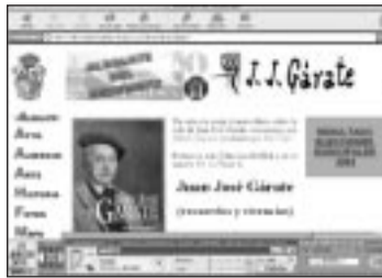
Albalate del Arzobispo