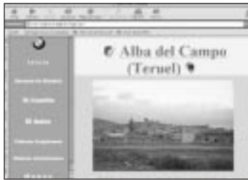
Alba del Campo