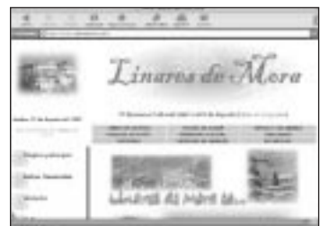
Linares de Mora